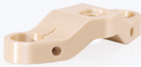
MTB ショックアブソーバ Z-PEI 9085