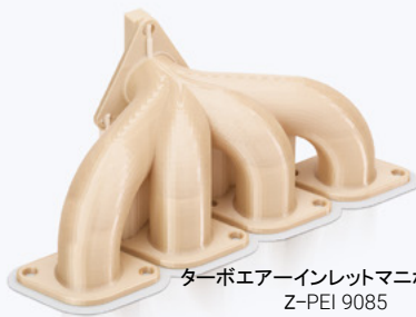
ターボエアインレットマニホールド Z-PEI 9085