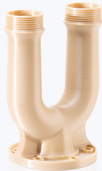
耐熱性U字型分岐水栓 Z-PEI 9085