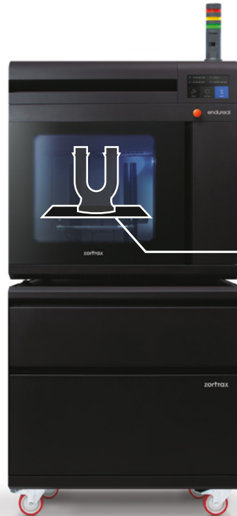
Zortrax Endureal 3D printer